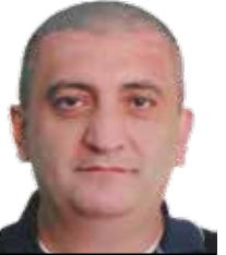
لبنان | زهير خيرالله

بعد انتهاء المشاركة الخارجية الآسيوية لفريق الشباب البترون، تعاود عجلة بطولة لبنان في الكرة الطائرة الإنطلاق مجدداً، حيث تقام مباريات أندية الدرجة الأولى في إطار الجولة الـ 16 (الخامسة من مرحلة الإياب) ويبدو أن صراع الصدارة سيتواصل مجدداً بين فريقين شباب البترون صاحب المركز الأول حالياً وبين ملاحقه الأنوار الجديدة صاحب المركز الثاني، وإن كانت الفجوة تتسع تدريجياً بين الفريقين. و تبقى الإثارة هي العنوان الأبرز في الجولات المتبقية، وبشكل خاص بين الفرق التي تتنافس على المربع الذهبي، وهي: قنات، بلاط، السلام صاليم، والشبيبة البوشرية.